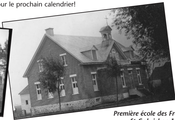
Première école des Frères St-Gabriel en 1901