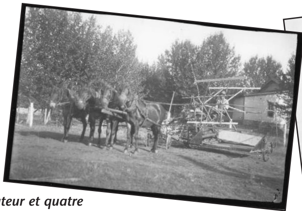
Cultivateur et quatre chevaux tirant une batteuse

N'hésitez pas à nous faire part de vos suggestions pour le prochain calendrier!